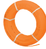
PE-RT Oksijen Bariyerli