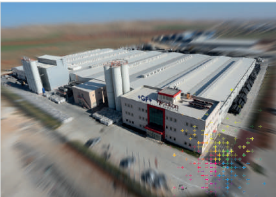
Georg Fischer Hakan Plastik Şanlıurfa Üretim Tesisleri

2013 yılında GFPS, Hakan Plastik'i satın almıştır. Türkiye'nin en önemli plastik boru ve ek parça üreticileri arasında yer alan Hakan Plastik, dünyada bu işin uzmanı olan marka ile güçlerini birleştirerek değişim için önemli bir adım atmıştır. 1965 yılında kurulan Hakan Plastik, Türkiye'de sessiz boruyu ilk üreten firma olarak büyük başarılarla imza atmış, kuruluşundan beri gelişime ve değişime verdiği önemi ürün ve hizmetlerine de yansıtmıştır.