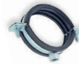
Standart Somunlu Keleçe Metal