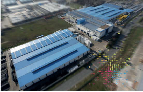
Georg Fischer Hakan Plastik Çerkezköy Üretim Tesisleri

Georg Fischer 1802 yılında kurulmuş İsviçre merkezli bir firmadır. 3 ana iş kolunda faaliyet göstermektedir: GF Piping Systems (Boru Sistemleri), GF Casting Solutions (Hafif Döküm Çözümleri) ve GF Machining Solutions (Talaşlı İmalat Çözümleri). 32 ülkede 45 üretim tesisine sahip GF, boru sistemleri alanında plastik ve metalden yapılmış boru sistemleri konusunda dünyadaki lider kuruluşlardan biridir. GF Piping Systems (GFPS), su ve gazın sanayi, kamu hizmetleri ve yapı teknolojisi içinde güvenli bir şekilde taşınması için sistem çözümleri ve yüksek kaliteli bileşenler üretmektedir. 3 ana gruba sahip GFPS, üst yapı, alt yapı ve endüstriyel alana yönelik olarak 60.000'den fazla ürün sunmaktadır.