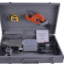
Kaynak Seti - Ekonomik