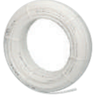
PE-RT Düz Boru