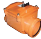
HT-PP Villa Tipi Kilitli Çekvalf