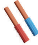
PE-RT Oksijen Bariyerli Kılıflı